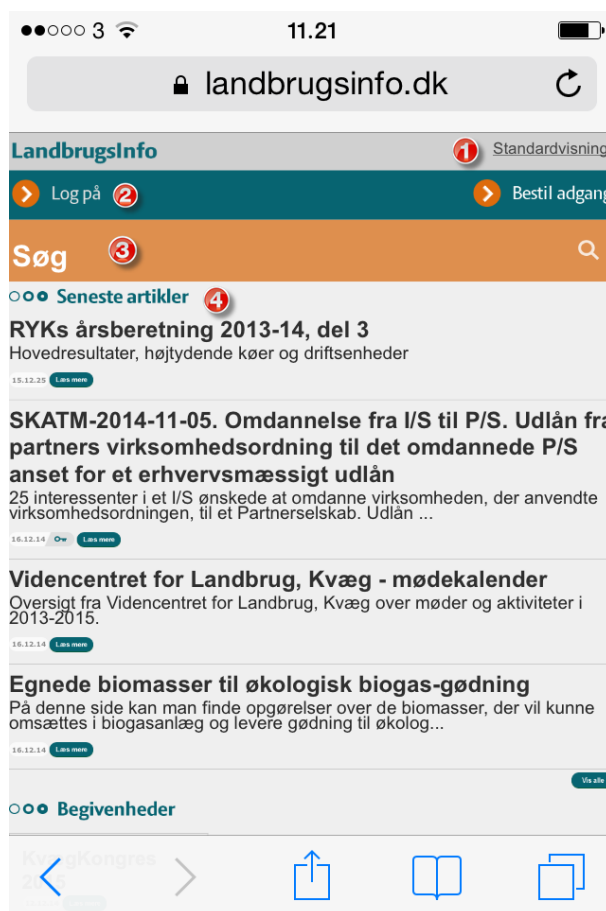
Billede 2: Mobilvisning af forsiden