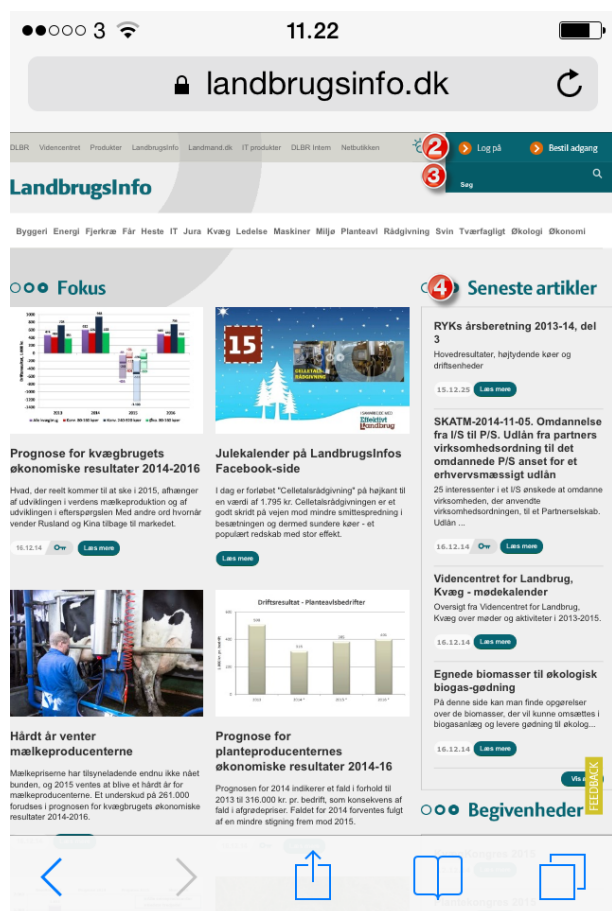
Billede 1: Standardvisning af forsiden